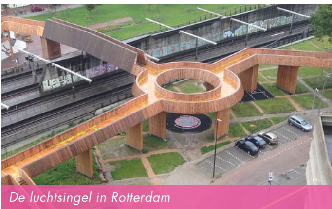
De luchtsingel in Rotterdam

Een bekend Nederlands civic crowdfunding project is de Luchtsingel in Rotterdam. De gemeente zet drie jaar lang een grote pot geld op tafel