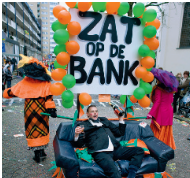
De crisis was een dankbaar onderwerp tijdens carnaval. Gemeenten lopen op tegen de gebrekkige kredietverlening van banken voor bouwprojecten